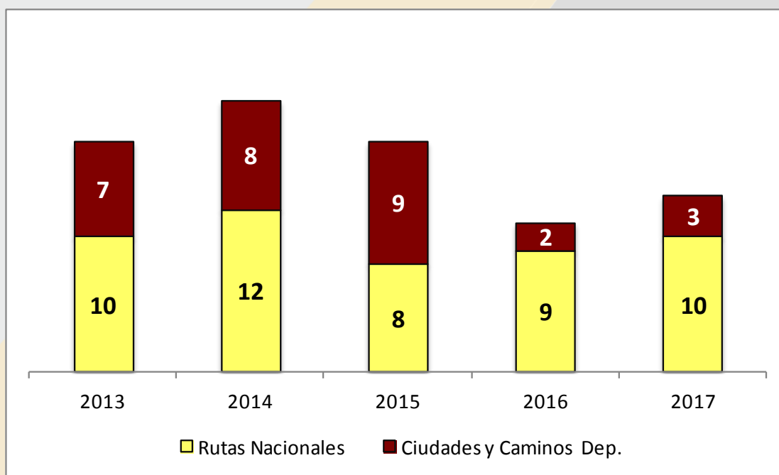
Gráfica 2) Cantidad de fallecidos en siniestros de tránsito desglosados según jurisdicción: