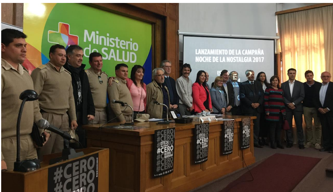
Lanzamiento Noche de la Nostalgia 2017

Unidad Nacional de Seguridad Vial / Policía de Nacional de Tránsito / Direcciones Departamentales de Tránsito / Jefaturas de Policía Departamentales / Ministerio de Salud-Direcciones Departamentales de Salud